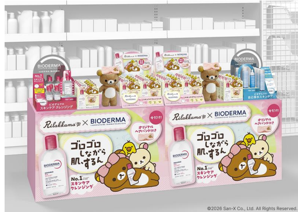
左：小窓からヘアバンドのリラックマ刺繍が覗く商品パッケージ / 右：店頭什器陳列イメージ