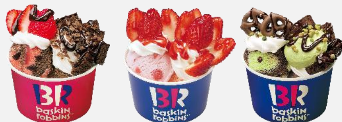
ストロベリー&チョコレート コレクション