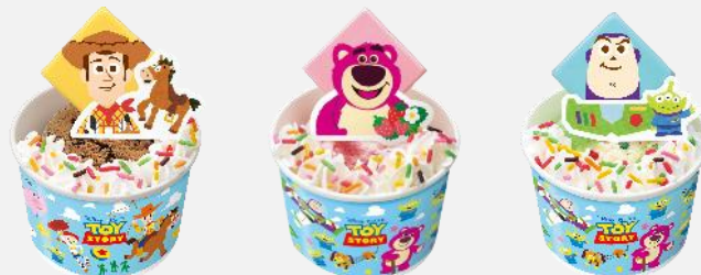
トイ・ストーリー/サンデー

© Disney/Pixar. Slinky Dog © Just Play LLC. MR. POTATO HEAD® and MRS. POTATO HEAD® are registered trademarks of Hasbro, Inc. Used with permission. © Hasbro, Inc. All Rights Reserved.