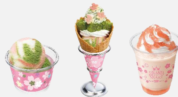
サーティワン さくらさくら