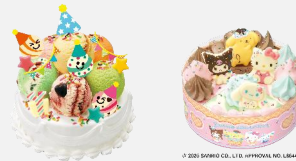
アイスクリームケーキ

© 2026 SANRIO CO., LTD. APPROVAL NO. L864461