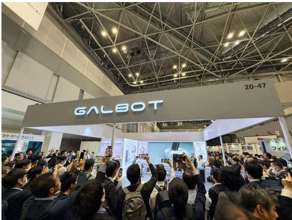
▲東京ビックサイト「ヒューマノイドロボット EXPO」の様子 (2026年4月15日～17日の3日間において開催)

具体的な施策として、今後開催される国内での展示会などへの出展を含めて、事業の実装フェーズへの移行としてプロモーション展開も開始していきます。