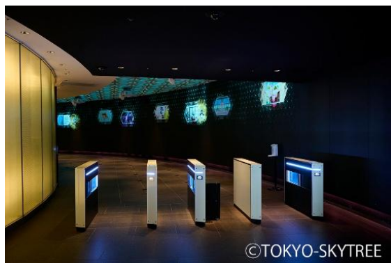
△東京スカイツリー4F 新入場ゲート

また、複数の販売チャネルを横断した残数枠管理に対応することで、販売状況の把握やチケット在庫管理を一元的に行うことが可能となりました。団体予約についてもWebでの受付に対応し、入場予約に加えて駐車場予約などの設備予約まで含めた一元管理を実現しています。