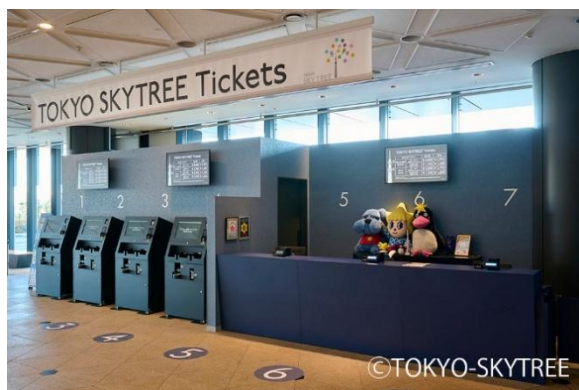
△東京スカイツリー4F 新チケットカウンター

近年、ビザ要件の緩和や円安の影響を背景に、訪日外国人観光客が増加する中、観光施設においては多言語対応や販売チャネルの多様化が進んでいます。また、オンライン旅行会社（OTA）の利用拡大により、価格設定や在庫管理、販売タイミングなど、運営面で考慮すべき要素も広がってきました。