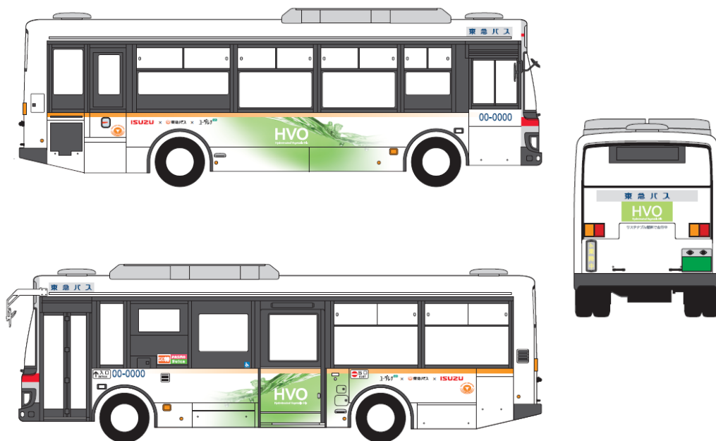
中型車(イメージイラスト)