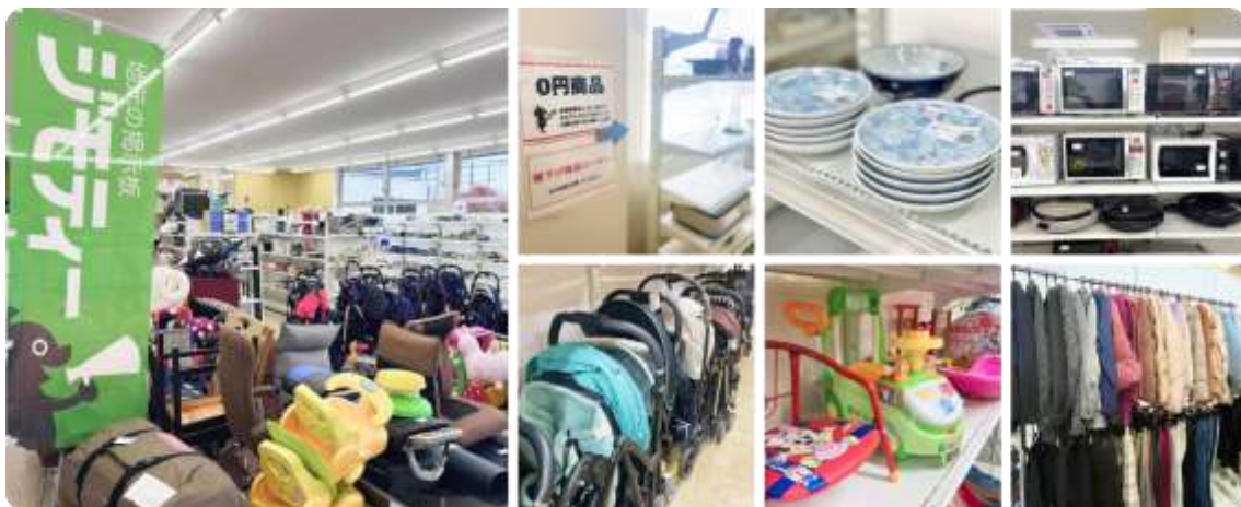
ジモティースポットの様子(写真は他店舗の様子)