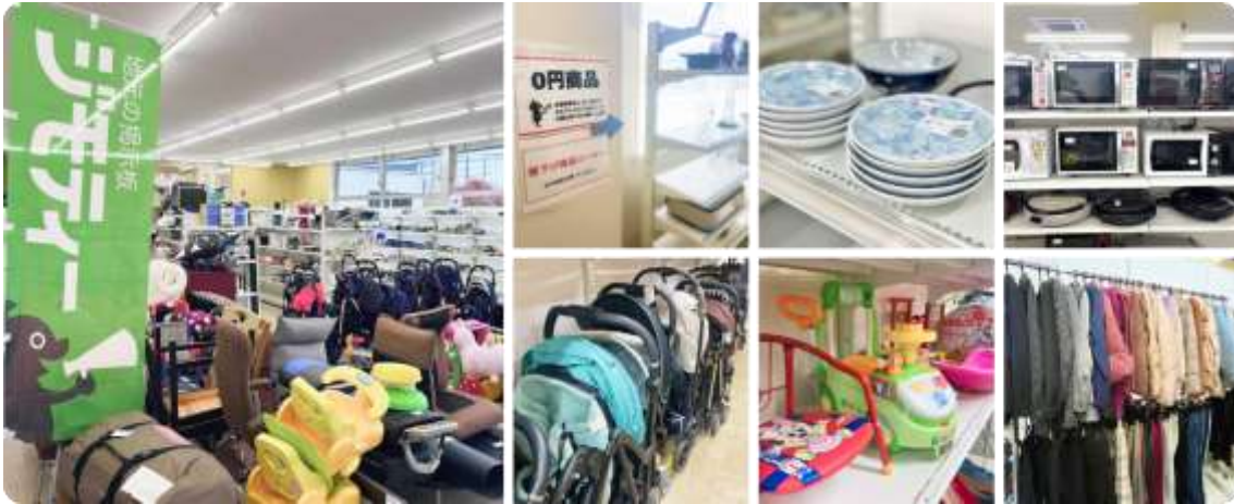
ジモティースポットの様子(写真は他店舗の様子)