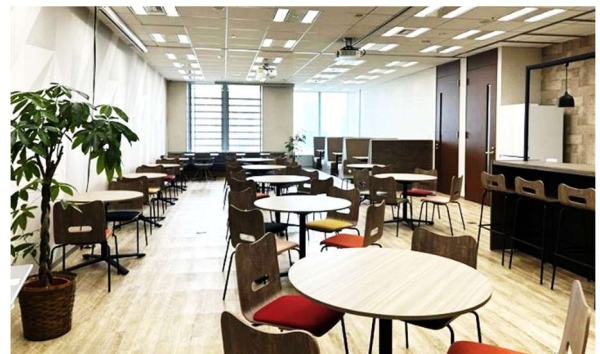
リフレッシュスペース

当社は、以前よりフリーアドレス制を導入し、柔軟な働き方と部門間のコミュニケーション活性化を推進してきました。しかし最近では、事業拡大にともなう人員増加により、会議室やコラボレーションスペースの不足が見られ、社員エンゲージメントを高めるためにも、より円滑なコミュニケーションを実現する環境整備が課題となっていました。