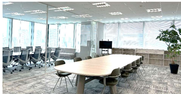
コラボレーションスペース