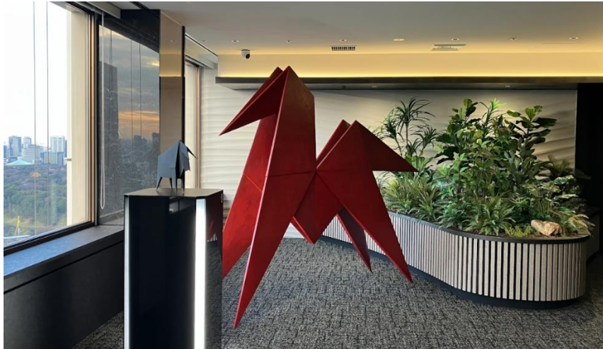
作品「神馬」 白谷 琢磨