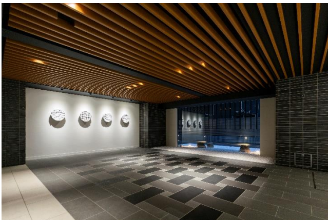
「creses」日暮里プロジェクト設置