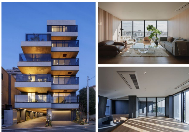
【THE GRANDUO YOGA 外観・内観】

当社は、東京都世田谷区用賀に、敷地特性を徹底的に活かし唯一無二の空間デザインが施された高級賃貸レジデンス「THE GRANDUO YOGA（ザ グランデュオ ヨウガ）」が完成したことをお知らせいたします。