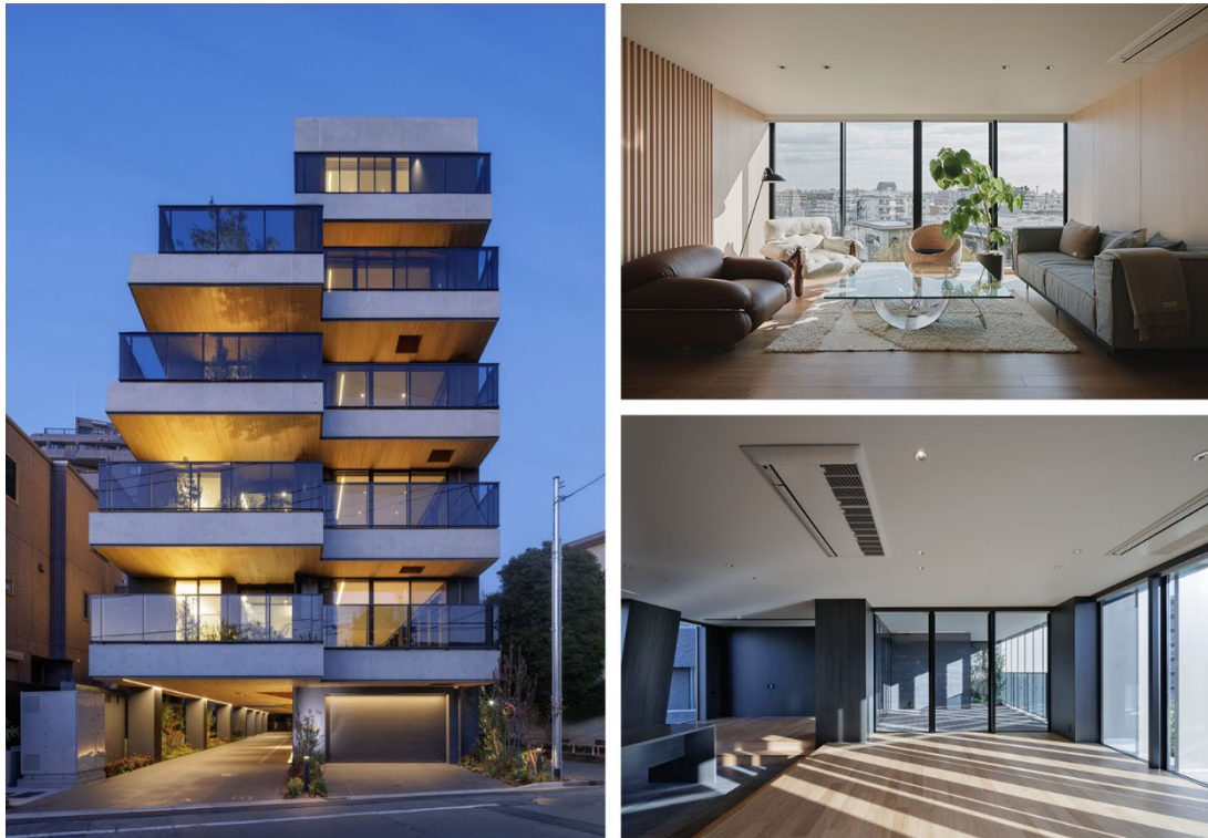
【『THE GRANDUO YOGA』 外観・内観】