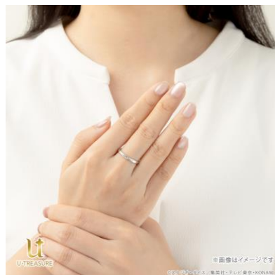
シルバー925 着用イメージ