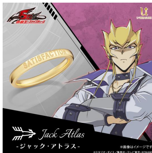
「ジャック・アトラス」モデル