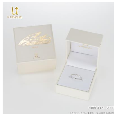
ロゴ入りのボックスに入れてお届けします