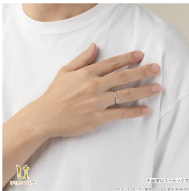
シルバー925 着用イメージ