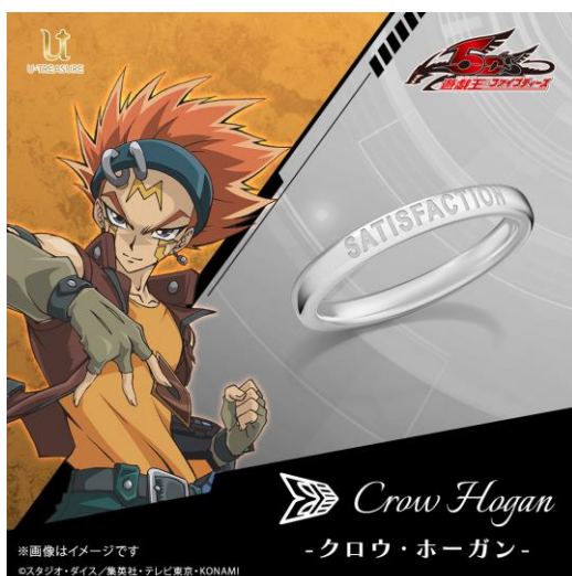
「クロウ・ホーガン」モデル