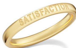
シルバー925（イエローゴールドコーティング）

※ジャック・アトラスのみシルバー925イエローゴールドコーティング ※画像はイメージです