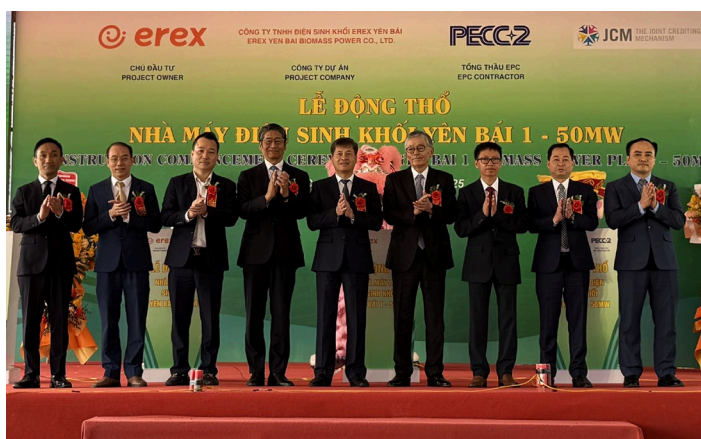
イエンバイバイオマス発電所