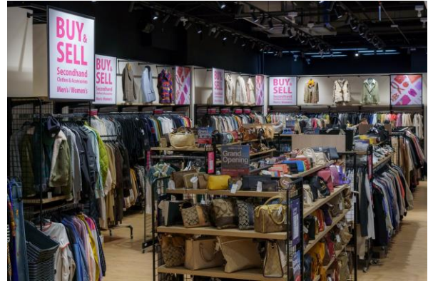
<『2nd STREET CITYLINK 三重店』売場>