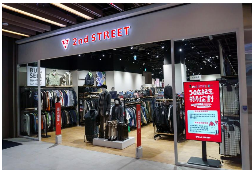
<『2nd STREET CITYLINK 三重店』外観>

セカンドストリートはリユース市場におけるリーディングカンパニーを目指すべく、国内のみならず海外においても積極的な出店を続けています。台湾においては、2030 年 3 月までに 100 店舗を出店する計画です。今後も海外での出店を加速させ、海外現地におけるリユースの認知度拡大および循環型社会の実現を目指します。