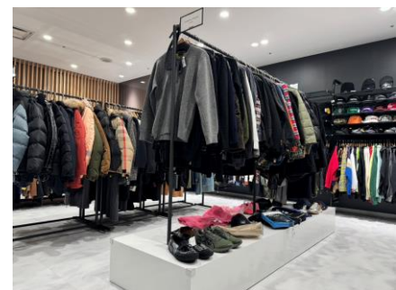
< 「TOKYO EDIT」 >

「COMME des GARÇONS」「sacai」「Yohji Yamamoto」など、海外でも評価の高い日本のデザイナーズブランドのアイテムを重点的に取りそろえたゾーン。ブランドの個性を象徴するアイテムや、アーカイブとして価値のある過去のシーズンアイテムなどをラインアップしています。