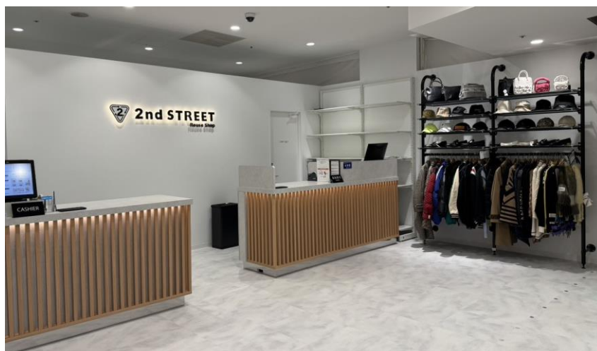
< 『セカンドストリート有楽町マルイ店』 >

セカンドストリートはコアなファッションニーズを持つお客さまの来店増加を図るため、コンセプトショップの出店に注力しています。今後も、さまざまなアイテムを取り扱うトータルリユースの店舗のみならず、エリアの特性に合わせたコンセプトショップを展開することで、お客さまにとって価値あるサービスを提供していきます。