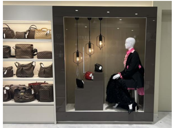
< 『セカンドストリート有楽町マルイ店』売場 >