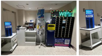
伊丹空港 南ターミナル1階店