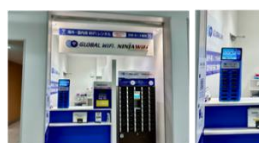
中部国際空港 第2ターミナル2階 カウンター