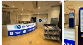
関西国際空港 第1ターミナル4階 出発ロビー 北店