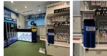
関西国際空港 第2ターミナル店

従来のスマートロッカー「スマートピックアップ」と比べてコンパクトで省スペースに設置できる「グローバルWiFi®レンタルステーション」は、今後も設置場所を順次拡大していく予定です。現在は新千歳空港・羽田空港・中部国際空港・伊丹空港・関西国際空港・福岡空港の6空港に設置しています。