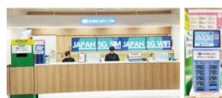
福岡空港 国際線ターミナル1階 カウンター