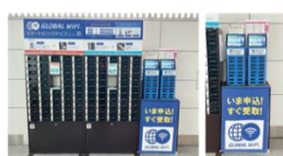
中部国際空港 アクセスプラザ 2 階

「グローバル WiFi® レンタルステーション」は、その場で借りてすぐに使えるモバイル Wi-Fi レンタルサービスです。1 台で国内はもちろん、海外 145 の国と地域でご利用いただけます。モバイルバッテリーとしてもご活用可能です。