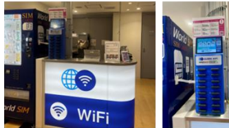
関西国際空港 第1ターミナル4階 出発ロビー 南店