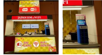
関西国際空港 第1ターミナル1階 到着ロビー 北店