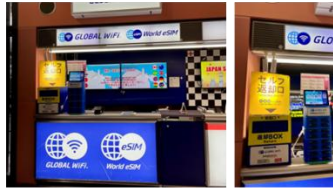
関西国際空港 第1ターミナル1階 到着ロビー 中央店