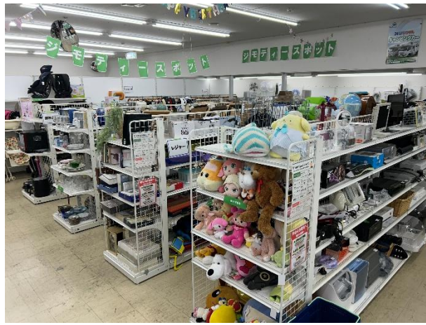
「ジモティースポット宗像店」店内写真