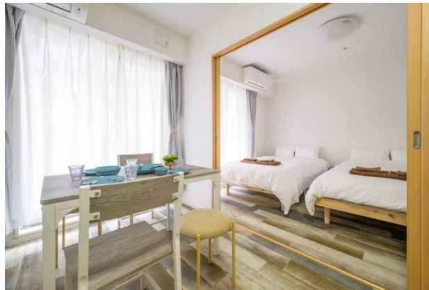
※最大5名利用可能な部屋

なにより最大の魅力は、高層階からのパノラマ夜景です。10階以上の客室からは、東京都心の煌めく夜景を一望でき、特に14階以上の部屋からは歌舞伎町タワーや新宿副都心の高層ビル群の眺望をお楽しみいただけます。