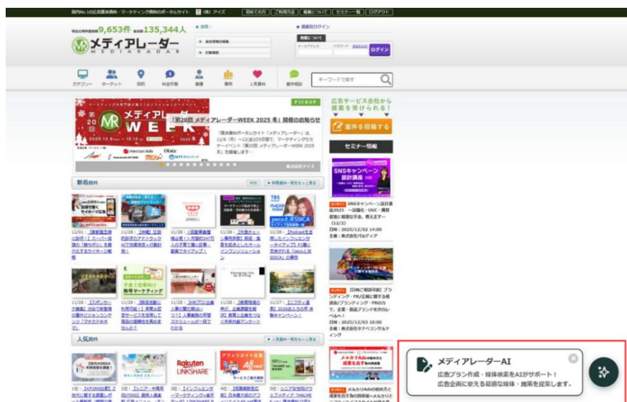
<メディアレーダーAI イメージ図>