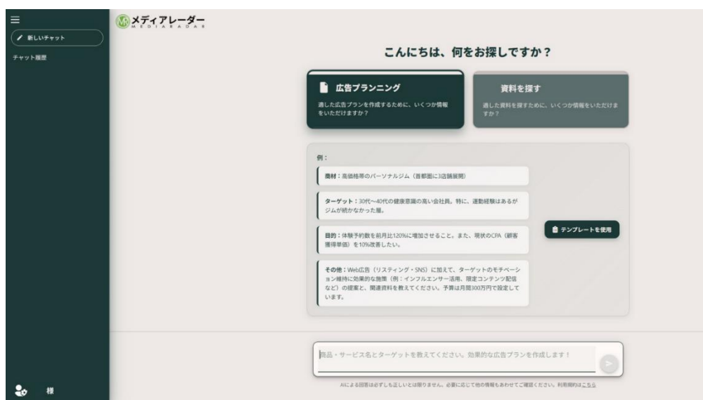
< メディアレーダーAI イメージ図 >