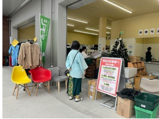
ジモティースポットの様子(写真はジモティースポット名古屋上小田井店)