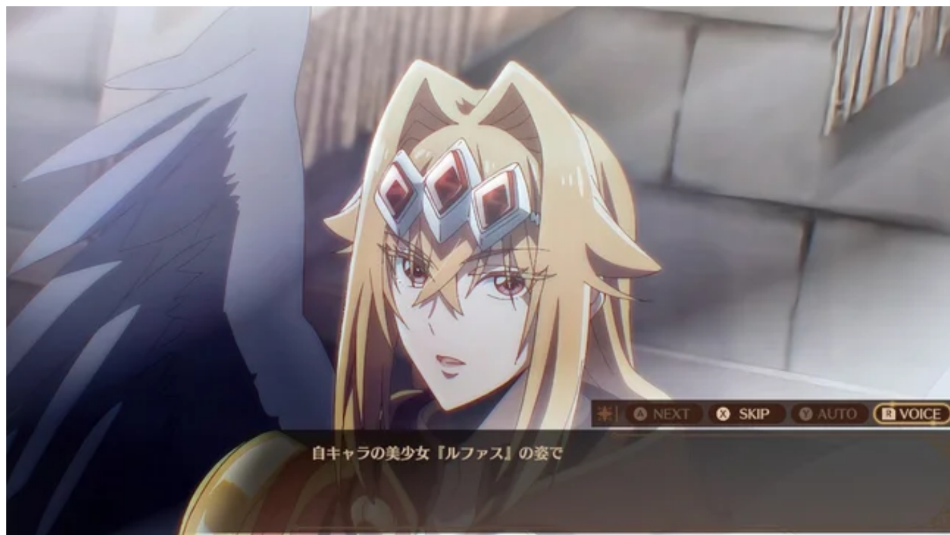
『黒翼の覇王』ルファス

プロローグにて「これまでのお話」を早口解説でご説明。キャラクター、世界観、ストーリーの流れを一気に把握していただけます。動体視力に自信のない方には「案内所」もございます。ここではゆっくり解説テキストや紹介画像をご覧くださいことが可能です。