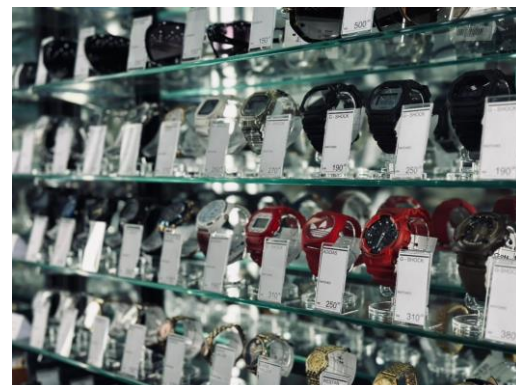
< 『2nd STREET Lotus's Shah Alam』 売場 >