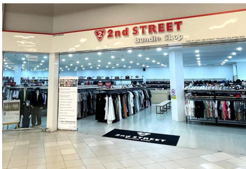
&lt;『2nd STREET Lotus's Shah Alam』外観&gt;

セカンドストリートトレーディングマレーシアは、出店エリアの拡大を視野に店舗展開を進め、2035 年 3 月までに 55 店の店舗網を構築することを計画しています。今後も、既存エリアでのドミナント出店に加え、新規エリアの開拓にも取り組むことで、事業基盤の強化と市場シェアの拡大を目指します。