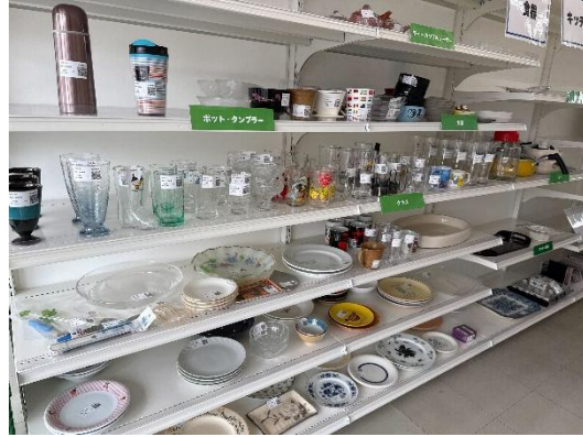
ジモティースポットの様子(写真はジモティースポット札幌白石店)