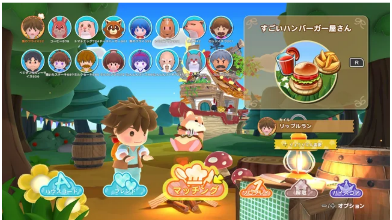
仲間がそろったらスタート！