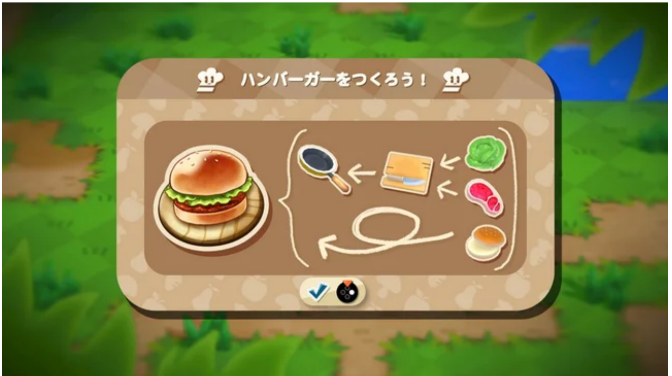
ハンバーガーを作ろう！