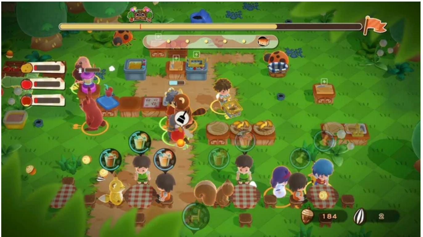
こちらは、キッチンとホール！