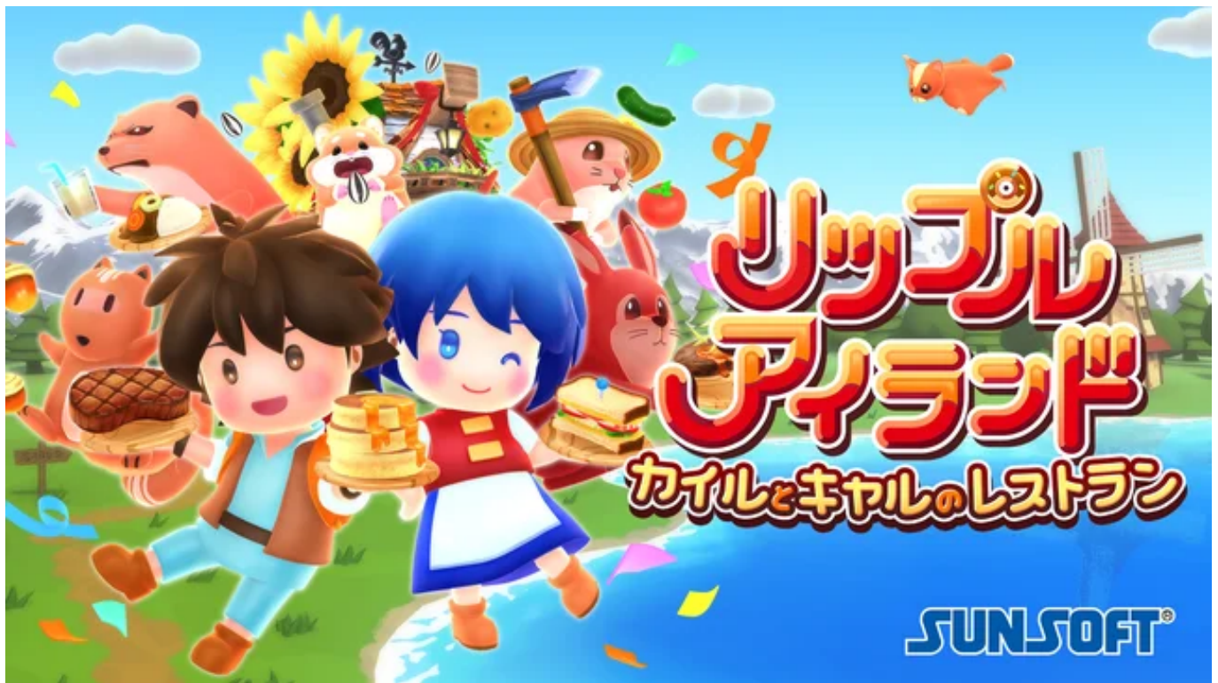
『リップルアイランド カイルとキヤルのレストラン』本日開店