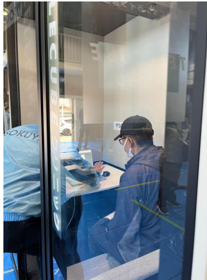
＜実際の訓練の様子＞

大地震などの災害発生時には、医師自身が被災して診療ができない、薬の配送ルートが寸断され配送が滞るといった深刻な医療供給の課題が発生します。バイキューブは、こうした非常時において、オンライン診療が果たす役割の重要性を強く認識しており、その解決法としてオンライン診療ブース「テレキューブクリニック」を開発しました。今回のデモンストレーションにおいても同様のケースを想定し、遠隔診療を実現する役割が期待されていました。