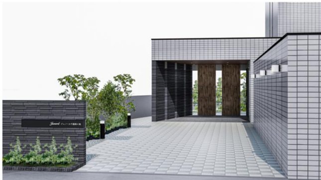
▲ 外観エントランス

ため、当物件のエントランスとポスト一体型宅配ボックスに DXYZ の顔認証 ID プラットフォーム「FreeiD(フリード)」を導入しています。