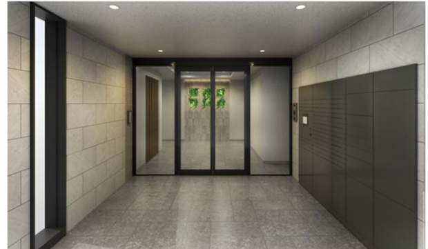
▲ 内観エントランス