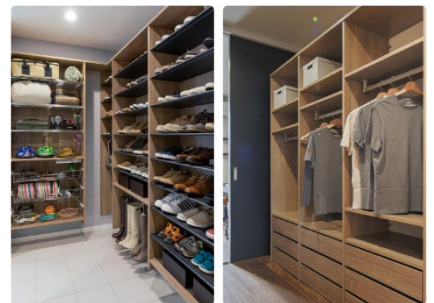
シューズクローク/ファミリークローク

家事楽の間取りには収納の充実が必要不可欠です。用途ごとに収納を配置し、大容量の収納スペースも確保。片付けが自然と習慣になり、掃除の手間も軽減します。