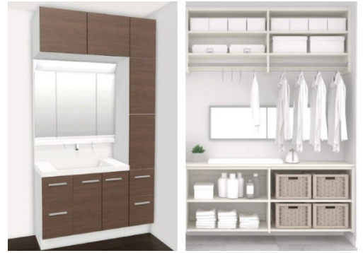
洗面化粧台／ランドリールーム

洗う・干す・畳む・しまうを1カ所で完結できるランドリールーム。カウンターとハンガーパイプを組み合わせた機能的な収納スペースで、家事効率が向上します。タオルや日用品ストックも収納可能。さらに、ガス乾燥機スペースや、予洗いができるスロップシンクも設置。回遊動線で、朝の移動もスムーズです。