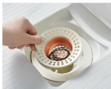
除菌薬すてへアキャッチャー