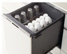
深型食器洗い乾燥機