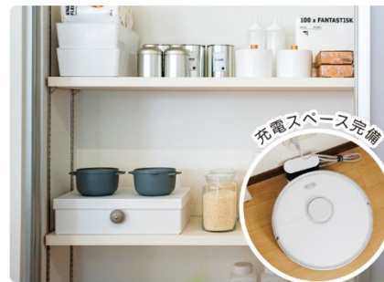
コンセント付きパントリー

ロボット掃除機の充電スペースやガス衣類乾燥機など、家電を活かすための専用スペースを設計段階から組み込み。家電と間取りの相乗効果で、日々の“家事時短”を実現します。