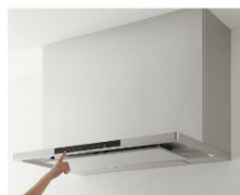
洗エールレンジフード