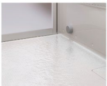
クリン床スプレー