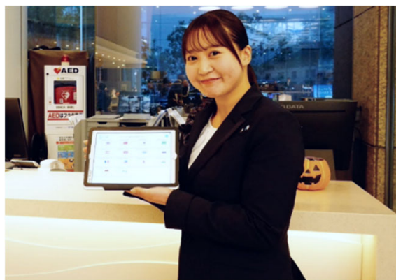
株式会社東京ドームホテル 宿泊部 ロビーサービス課 のスタッフ

まもなく迎えるクリスマスや旧正月、桜シーズンなどのインバウンド最繁忙期に向け、「みる通訳」は不可欠なインフラとなっています。多言語に加えて「みる通訳」は手話(日本手話)にも対応しているのでもうお客様への負担も減るのではないかと考えています。今後も、「みる通訳」を活用してすべてのお客様に快適なご滞在を提供していきたいと思っております。