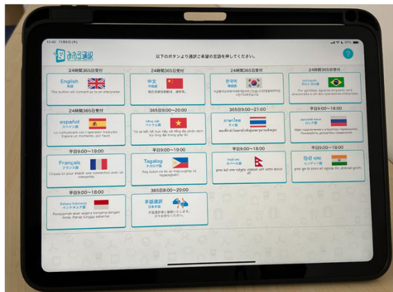
13言語と日本手話のオペレーターへの接続画面