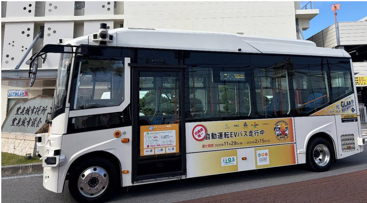
豊見城市内を走行する自動運転 EV バスの様子