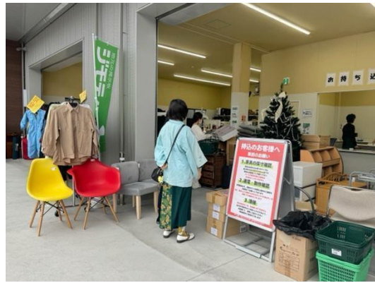
ジモティースポットの様子(写真はジモティースポット名古屋上小田井店)