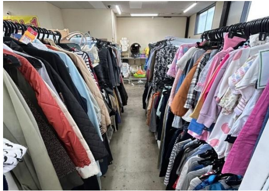
ジモティースポットの様子(写真はジモティースポット平塚店)