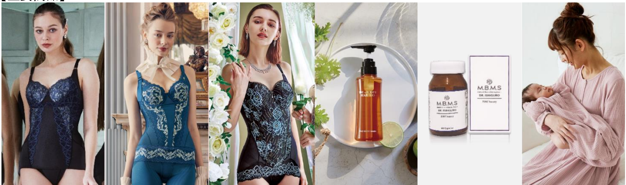
カーヴィシャス カレス シリーズ