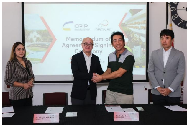
CPIP との署名セレモニーの様子