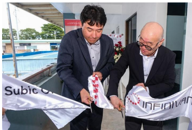
スービックオフィスの開所式にて

InfiniVAN はこれまで、フィリピン国内の大手金融機関や日系・現地企業などを含め、マニラ首都圏の中堅・大手を中心に法人向けインターネット接続サービスを提供してまいりました。今後も、新規顧客の開拓強化を通じ、強固な成長基盤としてまいります。