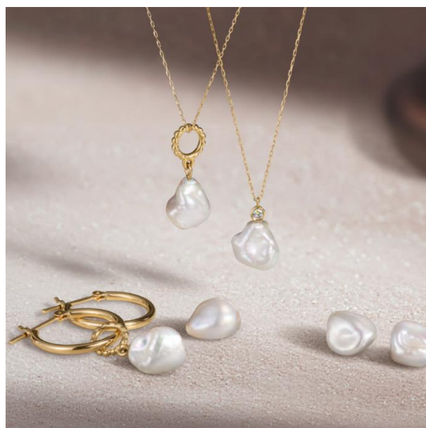
『Perlina -ペルリーナ-』 チャーム、ピアス、ネックレス