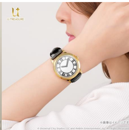
※画像はイメージです © Universal City Studios LLC and Amblin Entertainment, Inc. All Rights Reserved.