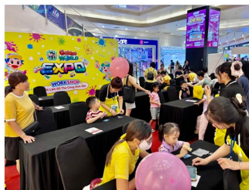
ベトナムリアルイベントの様子