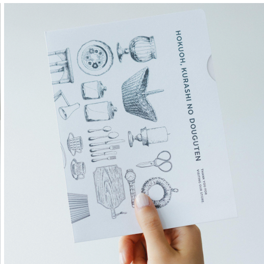
▲写真左から、新しくなった紙袋、納品書等を封入する書類ファイル

イラストを担当したのは「北欧、暮らしの道具店」のカレンダー等を手掛けるイラストレーターの miltata氏。