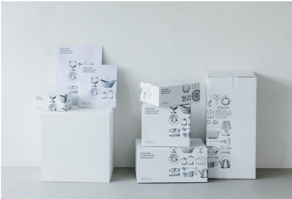
▲新デザインの段ボール

20周年を来年に控えた「北欧、暮らしの道具店」では、多様な顧客層へと広がる中で、オーセンティックでクラシカルな雰囲気大切にしながら、商品やコンテンツのカテゴリを拡大しています。こうした現在のサービスの雰囲気を顧客と共有するべく、4年ぶりの梱包資材のリニューアルを実施することにいたしました。