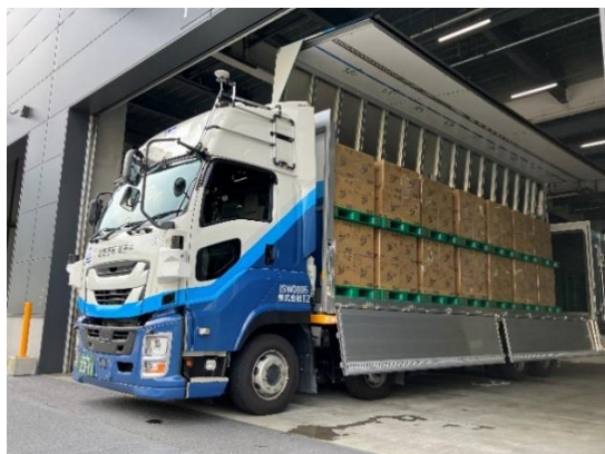
大王製紙のエリエール製品を積んだ T2 トラック

本実証は、化粧品・日用品卸売業最大手である P A L T A C とエリエールブランドのトイレットペーパーなどの日用品を生産・販売する大王製紙が、輸送に合わせた発注タイミングや積載率向上に向けた発注数量、運行スケジュールに合わせた入庫時間の調整を行い、レベル 4*2自動運転トラックによる幹線輸送を目指す T2 と共に、「2024 年問題」などを背景に将来トラックドライバー不足が深刻化するとされる長距離輸送の効率化を目的に開始しました。