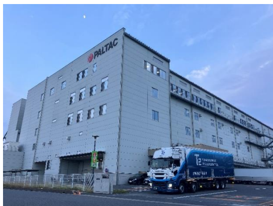
P A L T A C R D C 関東 と T2 トラック