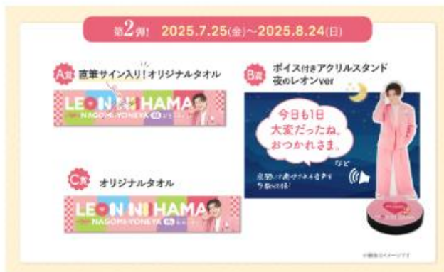
※2：SNS・レシート応募キャンペーン