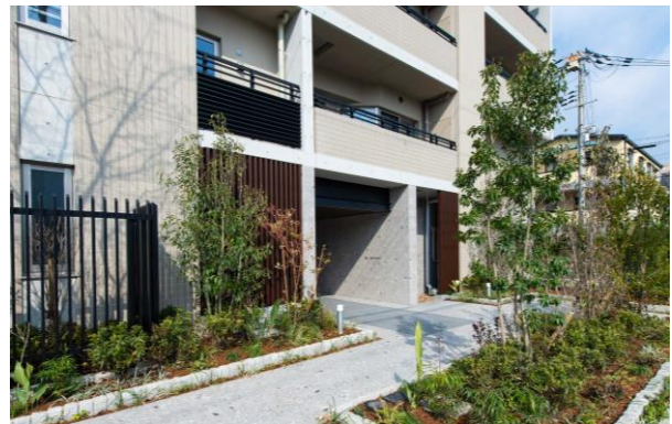
エントランスアプローチ