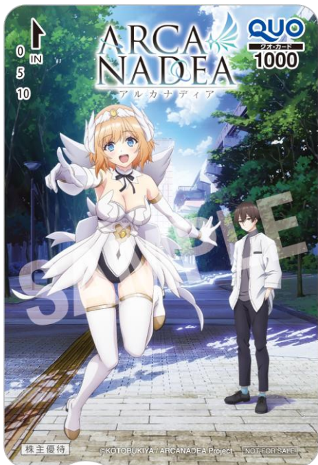
TVアニメ『アルカナディア』