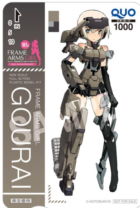
『フレームアームズ・ガール 轟雷』