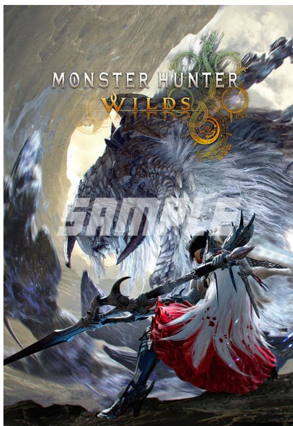
商品サンプル (Standard Edition 絵柄③)