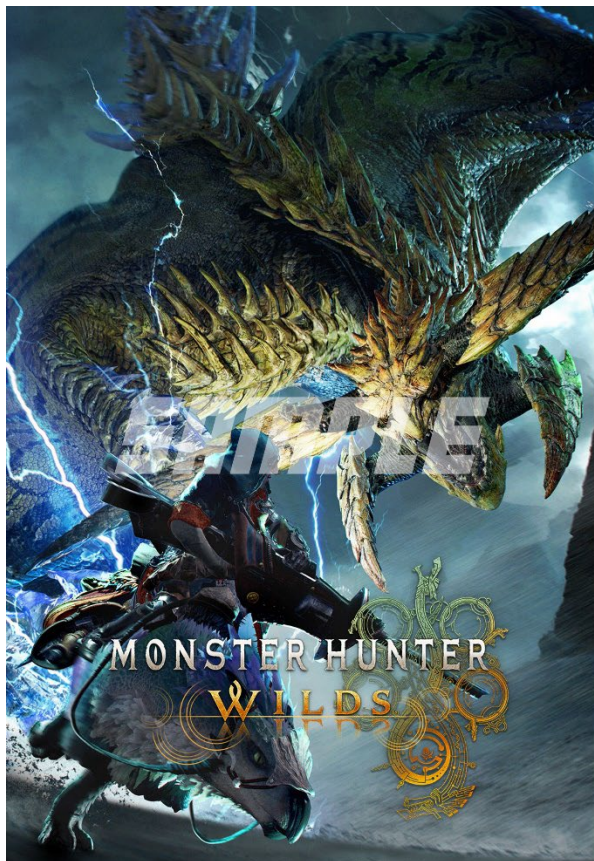
商品サンプル (Standard Edition 絵柄④)