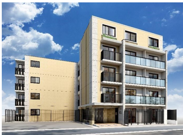
※「EL FARO(エルファーロ)」シリーズ