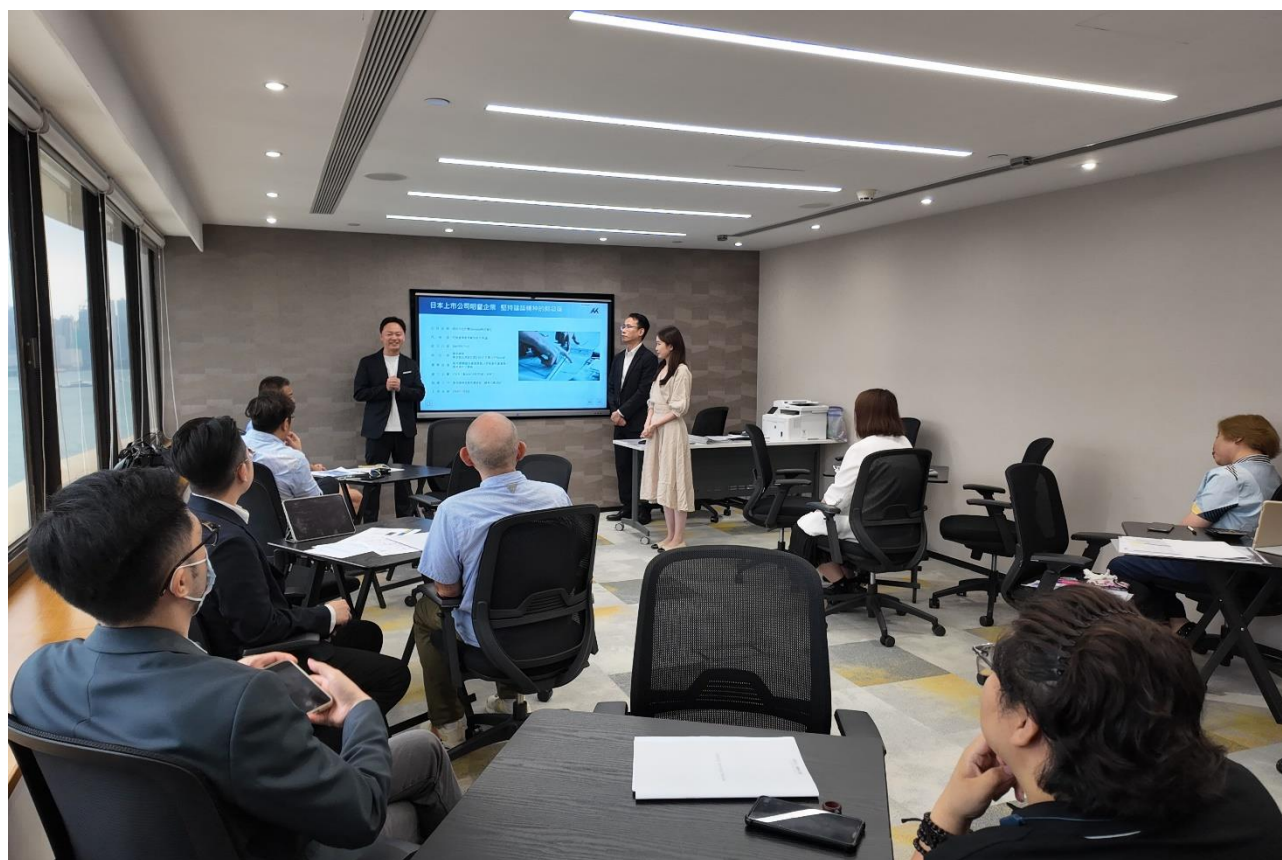
※香港で開催したセミナーの様子

https://altrata.com/reports/altratas-billionaire-census-2024