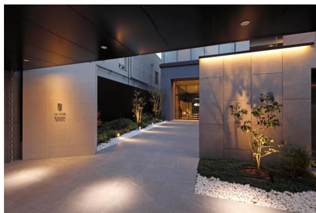
エントランスアプローチ