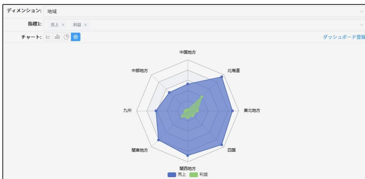
「レーダーチャート」イメージ

従来の棒グラフ、円グラフ、折れ線グラフに加え、新たに「レーダーチャート」が利用可能に。複数項目の比較やバランス分析に最適で、より多角的な視点からのデータ可視化を実現します。