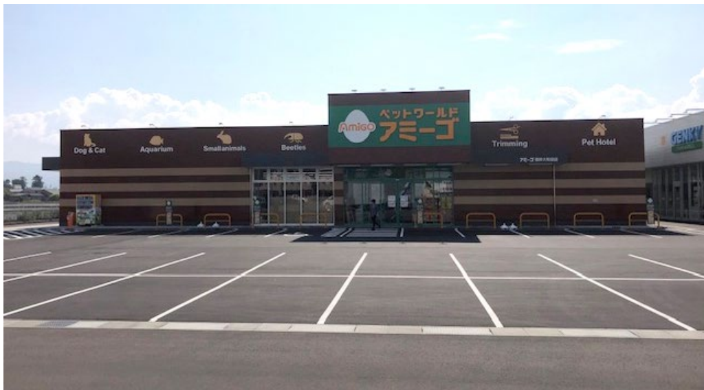
【ペットワールドアミーゴ福井大和田店外観】