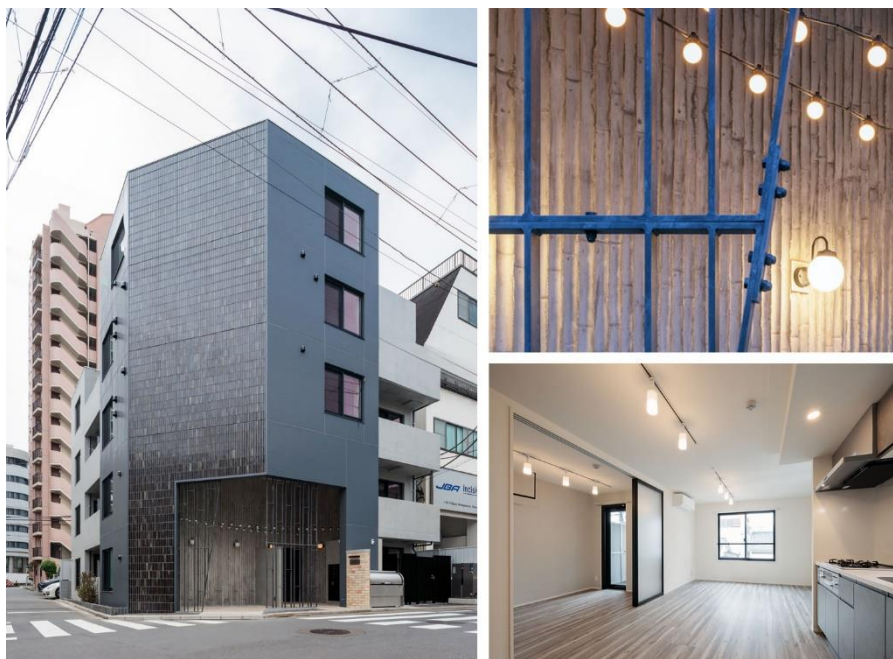
【GranDuo 戸越銀座 外観・内観】

当社は、東京都品川区荏原に、街の歴史や風情が感じられるエントランスが象徴的な自社開発物件「GranDuo（グランデュオ）戸越銀座」が完成したことをお知らせいたします。