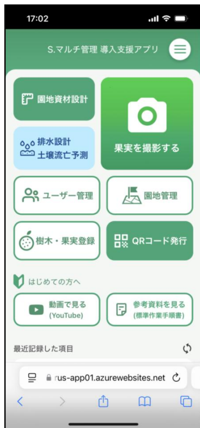
アプリケーショントップ画面

カンキツの高品質果実生産技術「シールディング・マルチ栽培（NARO S.マルチ）」における管理導入支援アプリを開発しました