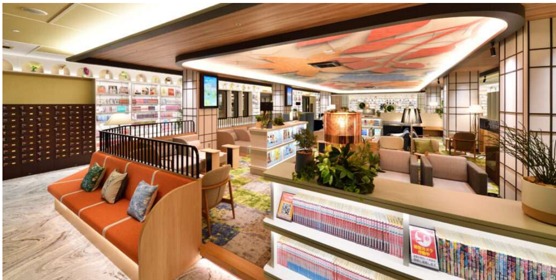
< forest villa（岩盤浴ラウンジ）：竜泉寺の湯 草加谷塚店（埼玉県） >

ランクインした施設の中には、「ニフティ温泉」のクーポンや電子チケットを使うことで、よりお得に利用できる場所もあります。ぜひ、コスパの良い温泉・スーパー銭湯をチェックしてみてください。