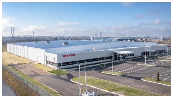
テネシー工場の外観

米国南東部に位置するテネシー工場では、家庭用および業務用のマヨネーズ・ドレッシングを製造し、中西部や東部への供給を担います。2 拠点生産体制になることで、これまで西部のカリフォルニア工場からの輸送にかかっていた時間とコストが低減され、東部エリアへの速やかな商品供給が可能になります。テネシー工場の新設により米国における生産能力は最大 3 倍まで拡大可能となり、さら