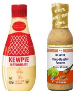
Q&B FOODS 製のキューピー マヨネーズ(左)と深煎りごまドレッシング(右)