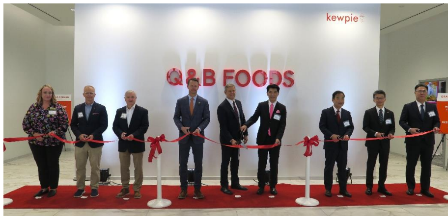
開所式 テープカットの様子