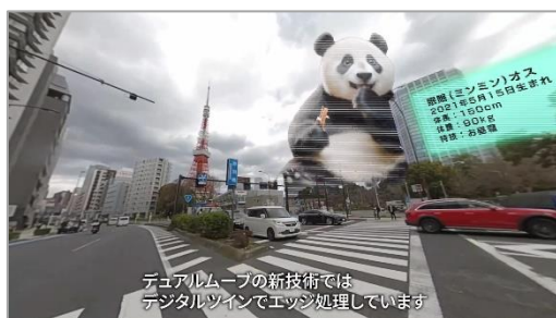
現実の車窓にパンダの映像を重ねたイメージ

https://youtu.be/A6hUdot_XzI?si=jQXnJvGLVtwfDEqv